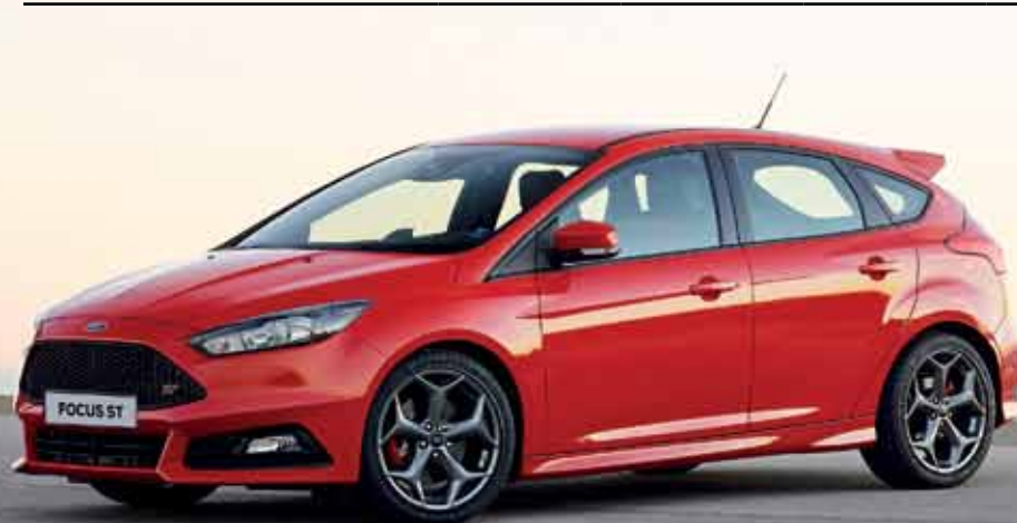
Ford Focus ST 5-drzwiowy w kolorze Race Red (standard) z opcjonalnym wyposażeniem

Wersja kombi - dopłata do ceny wersji 5-drzwiowej: 3000 PLN