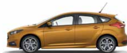
Electric Orange lakier metalizowany specjalny