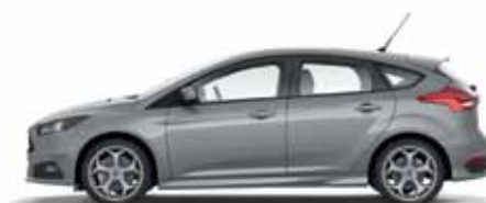
Moondust Silver lakier metalizowany