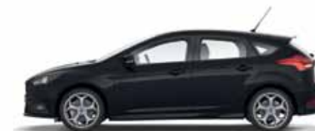
Mica Shadow Black lakier specjalny