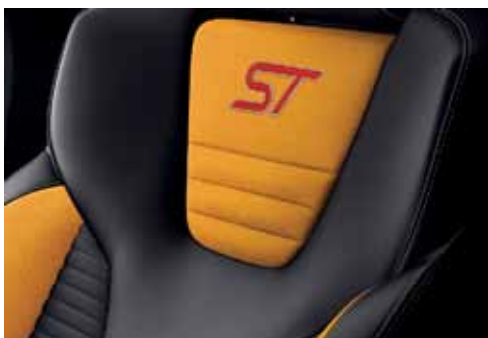
Tapicerka częściowo skórzana Lux ze wstawkami w tonacji Electric Orange