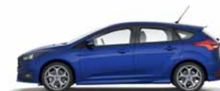
Deep Impact Blue lakier metalizowany