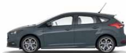
Stealth Grey lakier zwykły