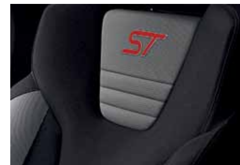
Tapicerka częściowo skórzana Lux ze wstawkami w tonacji Smoke Storm