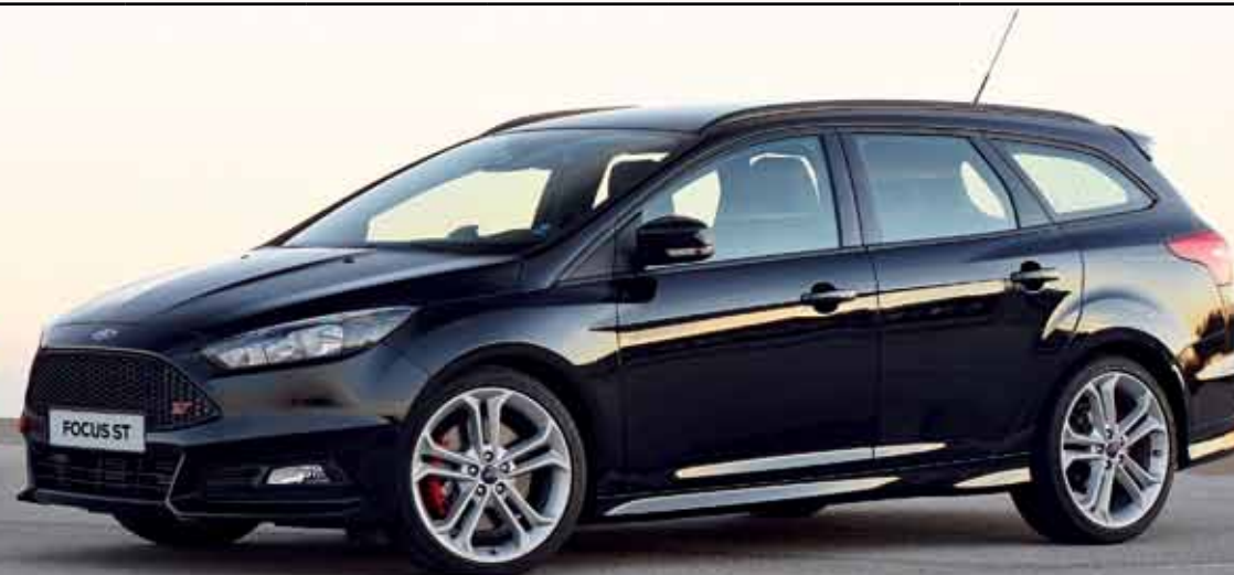
Ford Focus ST kombi w kolorze Mica Shadow Black (opcja) z opcjonalnym wyposażeniem.

* Fabryczne dane testowe Forda. **Podane wartości emisji CO 2 i zużycia paliwa zmierzone zostały zgodnie z wymaganiami technicznymi i wytycznymi Rozporządzenia europejskiego WE 715/2007 z późniejszymi zmianami WE 692/2008. Podane wartości zużycia paliwa i emisji CO 2 dotyczą wariantu pojazdu a nie konkretnego egzemplarza. Zastosowane pomiary mają na celu umożliwienie porównania powyższych parametrów w pojazdach różnego typu i różnych producentów. Wszystkie wartości pochodzą z testów, którymi poddawane były pojazdy o nadwoziu 5-drzwiowym, z podstawowym wyposażeniem, ze standardowymi obciążeniami kół i standardowym ogumieniem. Niestandardowe obciążenie i opony mogą mieć wpływ na poziom toksyczności spalin. Średnie zużycie paliwa (cykl mieszany): wartość średnia z obu części testu, ważona proporcjonalnie do drogi przebytej w każdej z części testu.