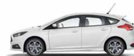
Frozen White lakier zwykły