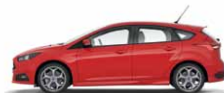
Race Red lakier zwykły