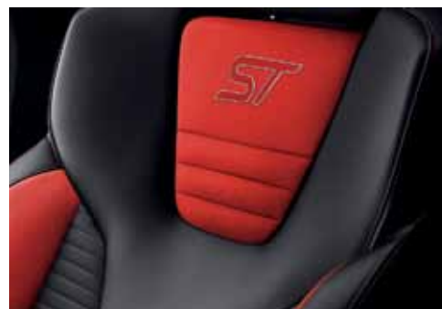
Tapicerka częściowo skórzana Lux ze wstawkami w tonacji Race Red