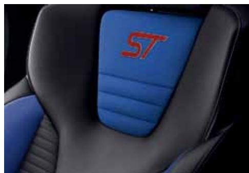
Tapicerka częściowo skórzana Lux ze wstawkami w tonacji Performance Blue